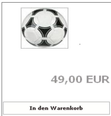
Bild 6: Fehlerhafte Preisangaben (z.B. kein Hinweis zur MwSt und zu weiteren Preisbestandteilen)

Verwenden Sie in Ihrem Shop keine korrekten Preisangaben (siehe Bild 6), verletzen Sie in Ihrem Shop die Markenrechte Dritter oder kommen Sie bestimmten Produktkennzeichnungspflichten nicht nach (siehe Bild 7), sind Sie also in der Haftung.